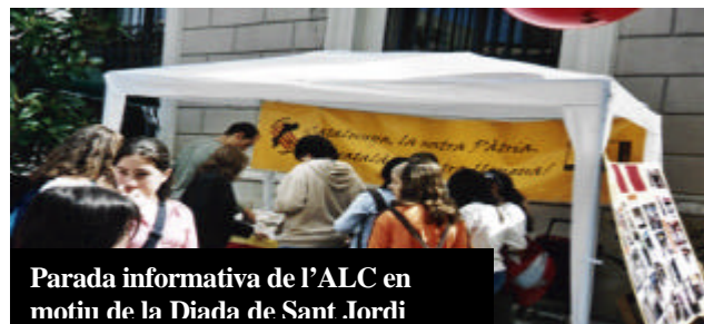
Parada informativa de l'ALC en motiu de la Diada de Sant Jordi

Un dels problemes dels catalans és que parlem i critiquem molt però, alhora de la veritat, ben poca cosa fem. I queixar-se en veu baixa però no actuar no serveix de res. Bo, si que serveix i bé que serveix però justament per perpetuar la injusta situació de la que ens queixem: d'una banda, perquè els dirigents espanyols segueixin amb les seves polítiques anticatalanes de segregació i secessió lingüística, de recursos contra el català, d'un bilingüisme que, lluny de ser enriquidor, no és més que pura i dura substitució lingüística i perquè, paral·lelament, molts dirigents catalans segueixin donant prioritat, amb un