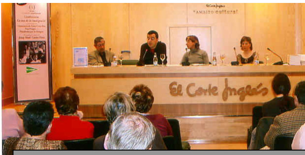
Conferència “La veu de la immigració”. Sala Àmbit Cultural d'El Corte Inglés de Sabadell. Participants: A.VV. Creu Alta, Veu Pròpia i ALC - Plataforma per la Llengua.

Que cada cop hi ha més immigració tant a Catalunya com a Sabadell és una evidència i que aquesta immigració no parla el català és un fet lògic i normal ja que al seus països d'origen no és necessari aprendre la nostra llengua per viure. Aquest fet però canvia a l'arribar a Catalunya on sí que hauria de ser necessari i normal saber el català per viure.